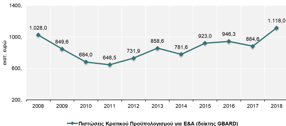
Διάγραμμα 1. Πιστώσεις κρατικού προϋπολογισμού για Ε&Α (σε εκατ. Ευρώ), 2008-2018

Πηγή: ΕΚΤ ( https://metrics.ekt.gr/gbard/datatables ), κωδικοί στοιχείων: ΚΠ1